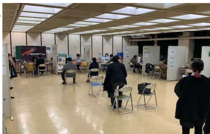
※前回開催時の会場内の様子